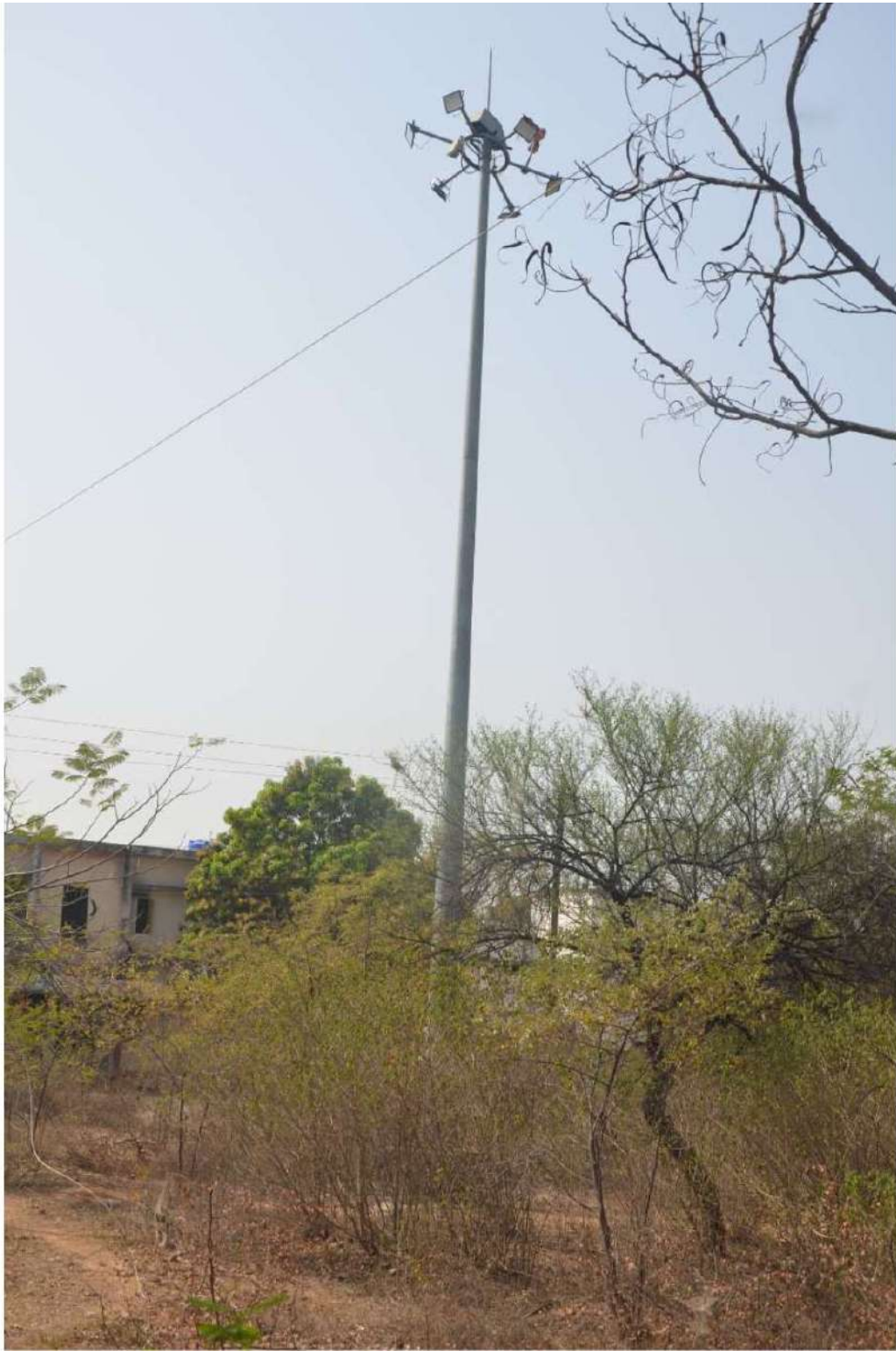
Light For Safety