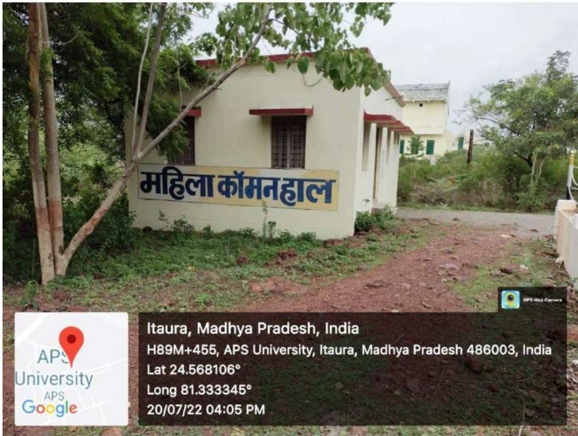
Women Common Room